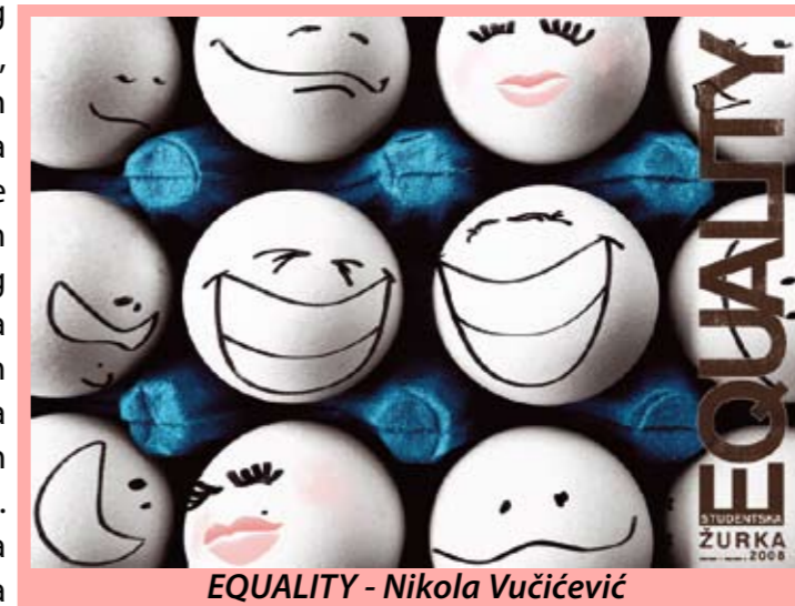
EQUALITY - Nikola Vučićević