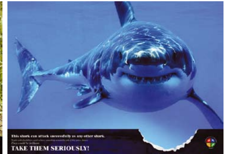
Plakati: Shvatite ih ozbiljno!